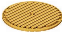
PT 25 Ø 350 mm (Abb.: Optional gold eloxiert)