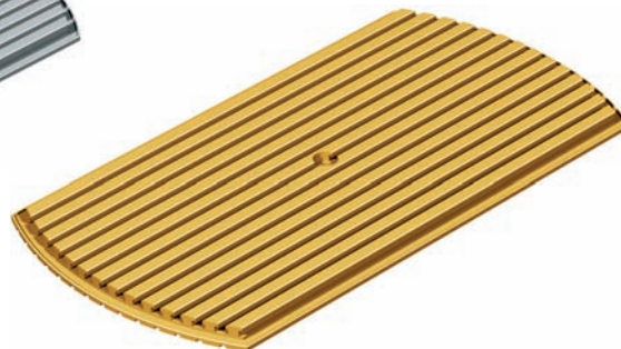
PT 25 x 375 Ø 750 mm (Abb.: Optional gold eloxiert)