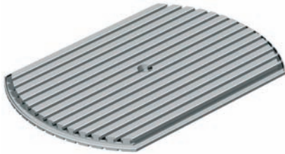
PT 25 x 375 Ø 600 mm